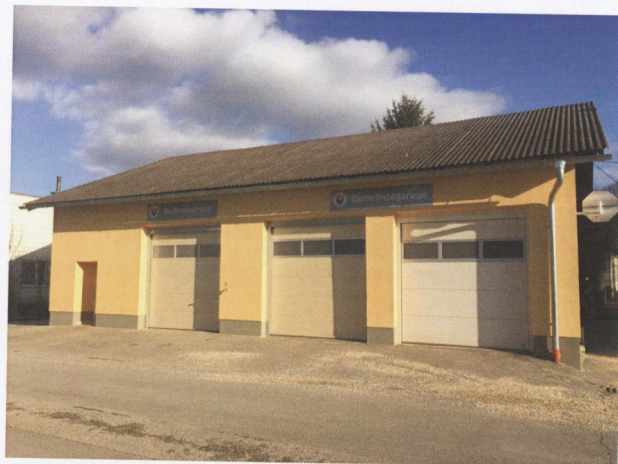
Instandhaltung Gemeindegebäude und Zubau Gemeindezentrum