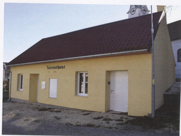
Sanierung Vereinshaus Streifing & altes FF-Haus

Standortsicherung Nahversorger, Modernisierung Volksschule, uvm.