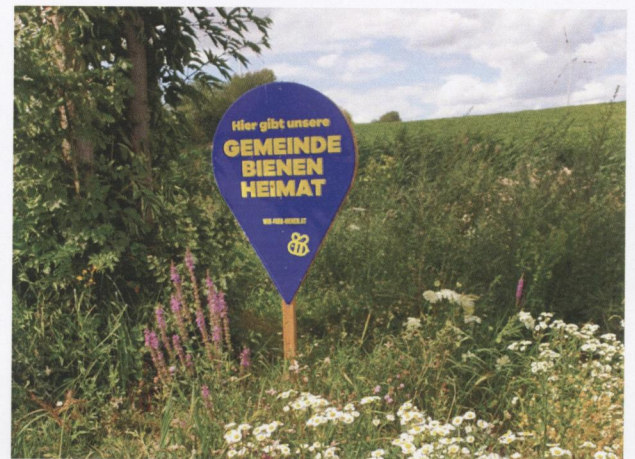
Erhaltung aller Naturanlagen