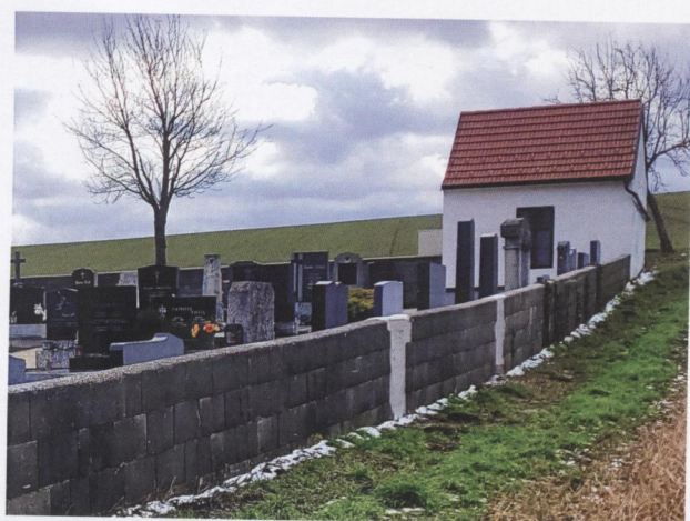
Sanierung der Friedhofsanlagen