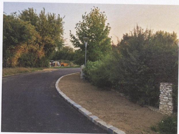
Straßen- & Leitungssanierungen