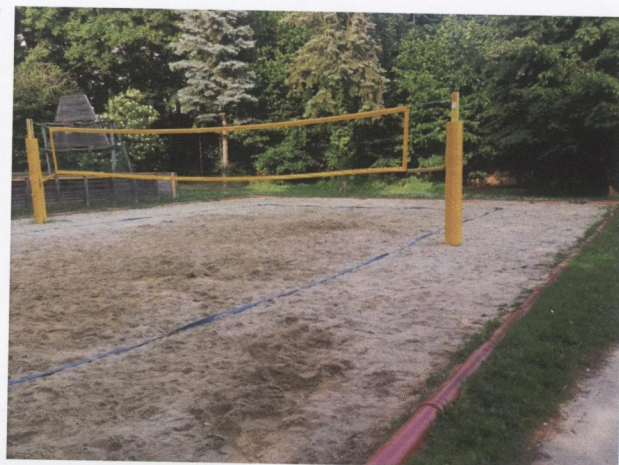
Erhaltung der Freizeitinfrastruktur