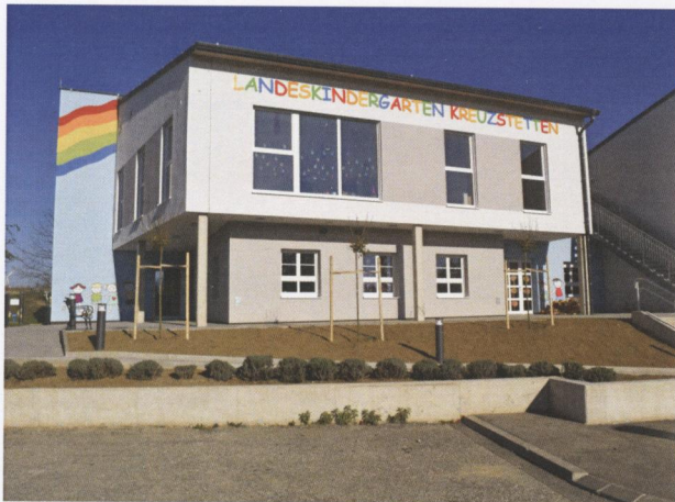
Sanierung & Ausbau des Kindergartens