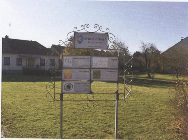
Arbeiten im Dorf