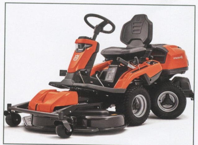
Unterstützung der Vereine im Ort

Ausbau Windkraftanlagen, Baumpflanzaktion, Wohnungssanierung Gemeindehaus