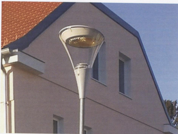
Modernisierung Straßenbeleuchtung im gesamten Gemeindegebiet